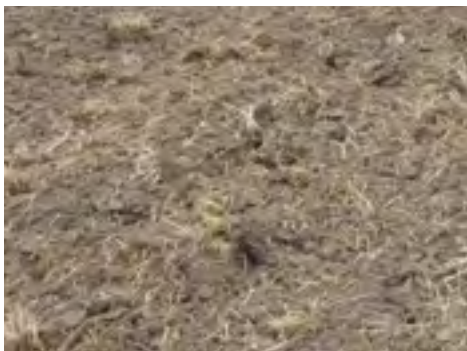
Оптимальне насінневе ложе для посіву по мульчі після поверхневого обробітку по стерні після пшениці

Нові системи мінімального обробітку можна застосовувати в органічному землеробстві лише у тому випадку, якщо вони матимуть приблизно таку ж врожайність, як і при застосуванні плуга, і не спричинять жодних серйозних проблем з бур'янами у довгостроковій перспективі.