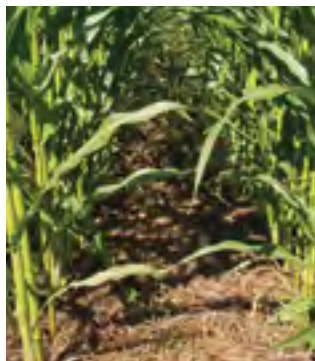
Кукурудза прямого посіву. Оптимальне приглушення бур'янів завдяки зеленим добривам, які відмерли

Перші дослідження у Швейцарії показали, що при застосуванні методу прямого посіву озимої пшениці або кукурудзи у сидерати за певних умов була отримана аналогічна врожайність, як і у випадку застосування плуга.