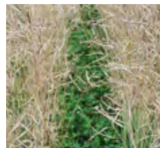
Підсів білої конюшини у ріпаку

Застосування підсівів здійснюється, як правило, у формі розкидного посіву у комбінації з обробітком пружинною бороною або котками безпосередньо в основну культуру, яка вже зійшла, також можлива сівба рядками. Хоча підсви не підтримуються дотаціями у Швейцарії, але вони мають такі переваги, як пригнічення бур'янів, фіксування азоту, покращення структури і пружності ґрунту, а також їх можна застосовувати у якості кормів. Якщо підсів залишається як штучне пасовище, то можна додатково заощадити на одному обробітку ґрунту та ефективно використати вегетаційний період. Конкуренція за воду та поживні речовини за певних умов можуть негативно вплинути на головну культуру.