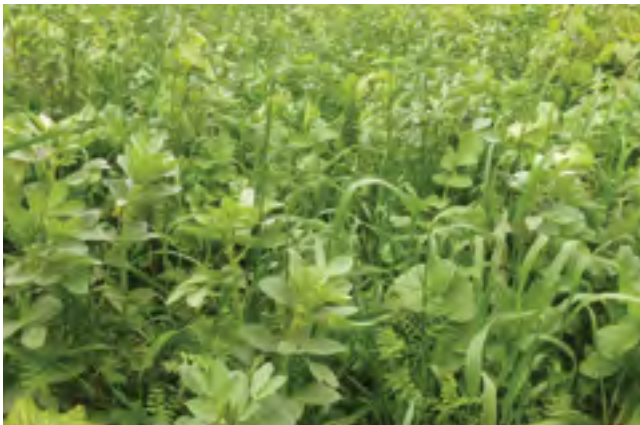
Сидерати з бобовими культурами покривають ґрунт, приглушують бур'яни та фіксують азот у ґрунті

Сівозміни з зерновими, кукурудзою та зернобобовими у суміші культур простіше перевести на мінімальний обробіток, ніж у сівозміни з чутливими до бур'янів культурами, такими як, соя, горох як чиста культура, цукровий буряк, соняшник, просо, льон, картопля або польові овочі.